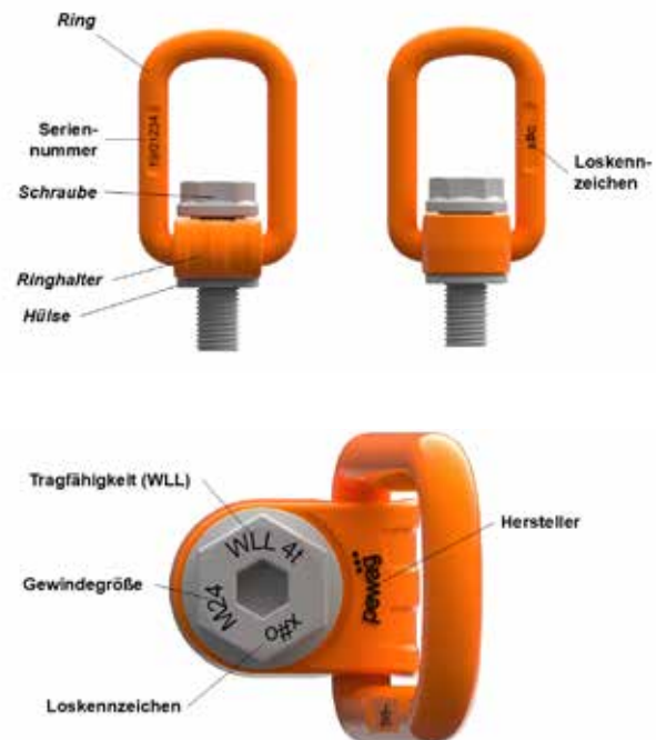
Bild 3: Teilebezeichnung und Ort der Identifizierungsdetails am Produkt

Jeder pewag Anschlagpunkt ist unter anderem gekennzeichnet mit der maximalen Tragfähigkeit bei ungünstigster Belastung, sowie Hersteller- und Loskennzeichen. Das folgende Bild zeigt die Teilebezeichnung und die genauen Identifizierungsdetails am Produkt.