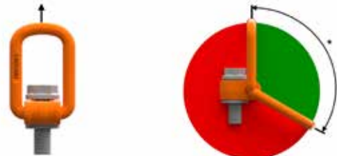
Bild 1: erlaubte Belastungsrichtungen die bei bestimmungsgemäßem Gebrauch auftreten können. *Ring darf die Last nicht berühren.

Belastung: Die Belastung darf nur in der vorgegebenen Richtung (Bild 1) mit der maximalen Tragfähigkeit lt. Tabelle 1 und unter Berücksichtigung der hier angegebenen Einsatzbedingungen erfolgen.