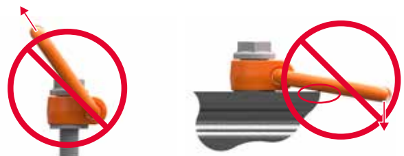
Bild 2: Nicht erlaubte Anwendung.

Einsatztemperatur: Die dauerhaft zulässige Umgebungstemperatur beträgt -40^{\circ}\text{C} bis +100^{\circ}\text{C} . Bei Anwendung außerhalb dieses Temperaturbereichs berücksichtigen Sie die Reduktionsfaktoren lt. Tabelle 2.